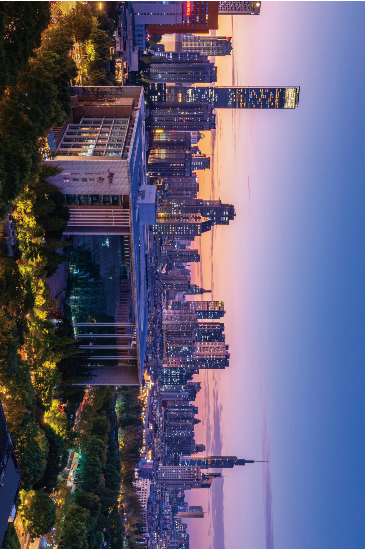
《长江路夜景》